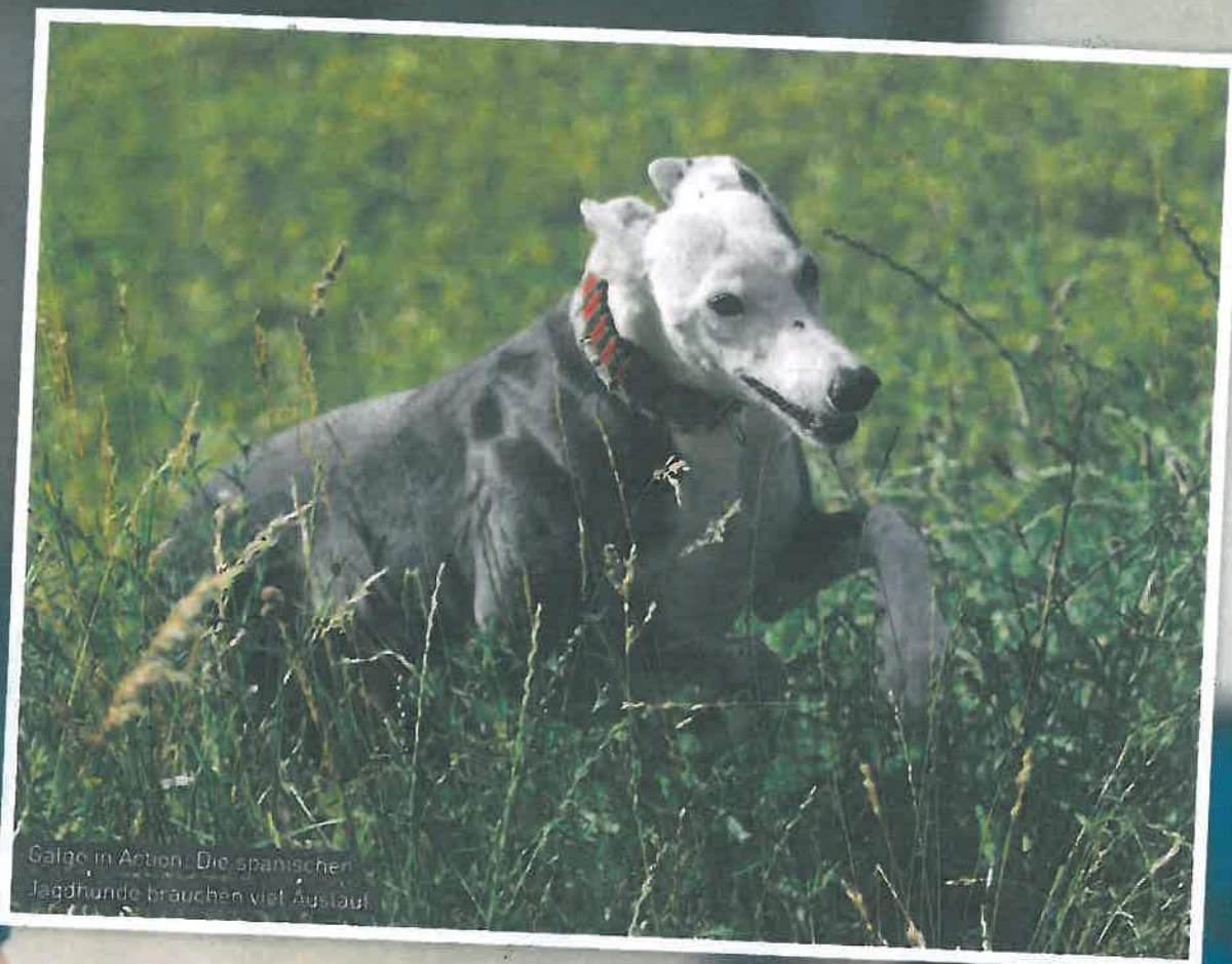
Galgo in Action: Die spanischen Jagdhunde brauchen viel Auslauf.