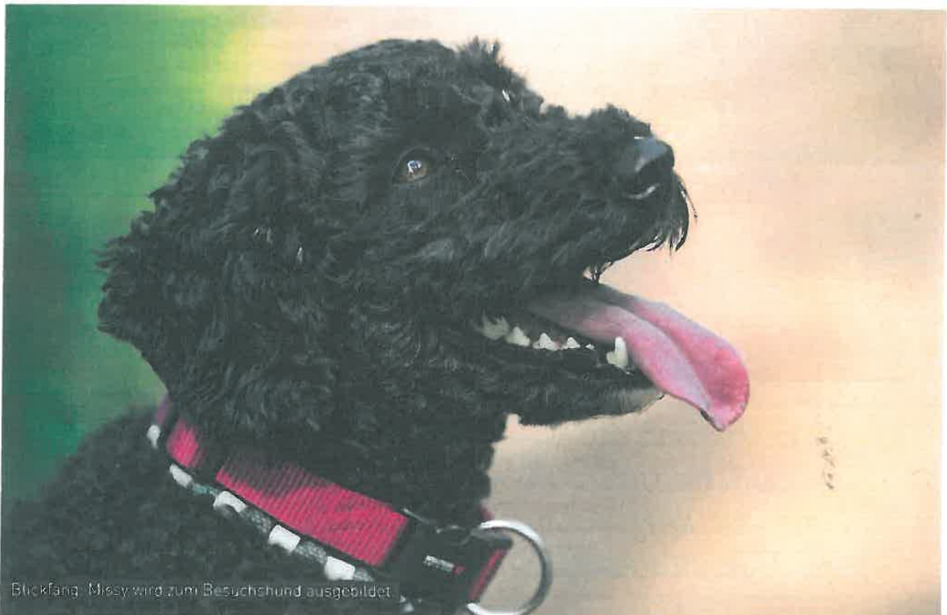
Blickfang: Miosy wird zum Besuchshund ausgebildet

Das Tierheim ist eine private Einrichtung und lebt vor allem von Spenden und zum Teil von einer staatlichen Konvention. Es untersteht dem Tierschutzbund. Ferron ist eine der ehrenamtlichen Helferinnen, die zusammen mit 17 Festangestellten, die vor allem im Tierpflegebereich und Sekretariat beschäftigt sind, arbeiten. Viele Besucher kommen nachmittags ins Tierasyl, um mit